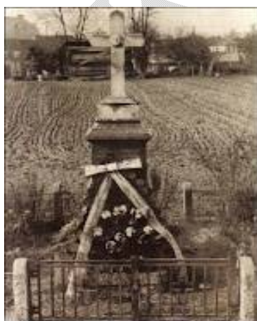
Drugi monument do dziś stoi w miejscu egzekucji.

Po zakończeniu wojny szczątki zamordowanych przeniesiono na Cmentarz Rakowicki. W miejscu ich spoczynku wzniesiono pomnik z imionami i nazwiskami zidentyfikowanych ofiar pacyfikacji.