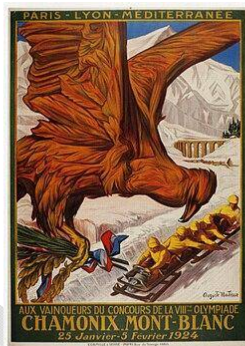
Plakat pierwszych Zimowych Igrzysk Olimpijskich

Jednym z najbardziej rozpoznawalnych symboli olimpijskich jest flaga zaprojektowana zgodnie z ideą Pierre de Coubertin – inicjatora nowożytnych igrzysk. Widnieje na niej pięć splecionych kół w różnych kolorach. Symbolizują one zarówno różnorodność narodów, jak i jedność mieszkańców wszystkich kontynentów. Barwy zostały dobrane w taki sposób, aby przynajmniej jedna z nich występowała na fladze każdego kraju świata. Flaga olimpijska jest uroczyście podnoszona podczas ceremonii otwarcia igrzysk. Nawiązując do tradycji starożytnej, pięć kół odnosi się także do pięciu dyscyplin sportowych uprawianych w antyku.