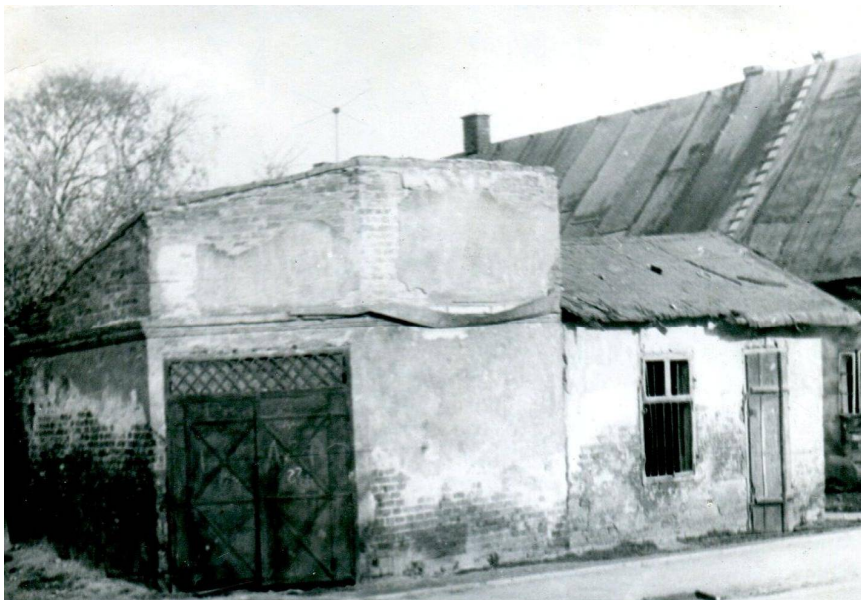
Bar Rybacki, wówczas przy ulicy Miedzianej, dziś są to okolice ulicy Widok.

Wkrótce potem z Baru Rybackiego wyprowadzono zatrzymanych mieszkańców Dąbia i również ich rozstrzelano.