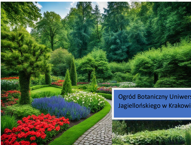
Ogród Botaniczny Uniwersytetu Jagiellońskiego w Krakowie